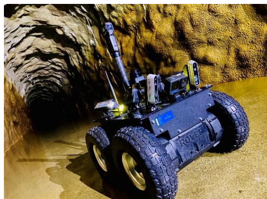
導水路(洞道)内で検証中の自動走行ロボット