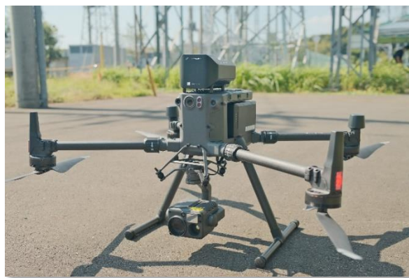
「BEP ライン」専用モジュールを搭載した DJI Matrice 300 RTK

今後、同社では今回の検証結果をもとに、本格運用に向けた検討を進めるとともに、送電設備の保守点検業務の安全性向上や効率化等を図るため、引き続き電力の安定供給に取り組んでいくとしています。