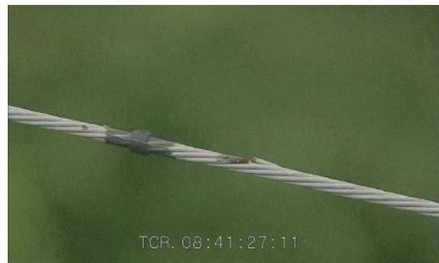
「架空地線」の素線切れの様子

社では、落雷による架空地線の素線切れやアーク痕などの設備損傷箇所を把握するために、定期的に架空地線点検を実施しています。具体的には、春先に、1年に450kmずつ、5年にかけて点検対象の総距離2300kmをヘリコプターから撮影。撮影後は動画を持ち帰り、時間をかけて目視点検を実施しています。し